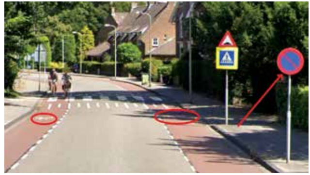
Bloemendaalseweg in Overveen, stoppen of doorrijden?

De gemeente Bloemendaal heeft nogal eens moeite met de interpretatie van fietsstroken en suggestiestroken. De Bloemendaalseweg in Overveen is een illustratief voorbeeld. De fietsstroken zijn er voorzien van geschilderde fietsjes, wat betekent dat je er niet mag parkeren en niet mag stoppen. Maar er zijn tevens RVV E1-borden geplaatst die de betekenis hebben dat