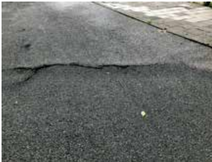
Foto links: Asphalt is niet bestand tegen wortelopdruk. Daardoor breekt het asphalt.

Het geasfalteerde fietspad had last van wortelopdruk en moest worden vernieuwd. Hiervoor is gebruik gemaakt van 'Easypath', dat eerder met succes is toegepast op een deel van het fietspad langs de Rijksstraatweg (aan de zuidkant van de Jan Gijzenbrug). Het bestaat uit gekoppelde betonplaten die ervoor zorgen dat boomwortels de verharding niet kapot kunnen drukken. Groot voordeel is dat ze voor fietsers veilig en comfortabel zijn. Als (lokale) Fietsersbond zijn we supporter van 'Easypath'.