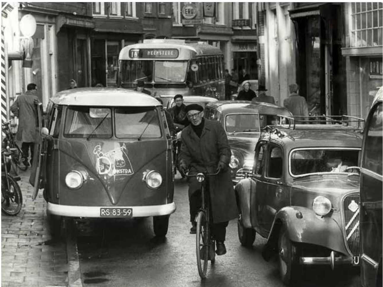
Fietsers, auto's en een stadsbus in de Gierstraat (1958)

Zie ook onze website voor de inspraaknotitie die wij hierover hebben opgesteld: https://haarlem.fietsersbond.nl/dossiers2/haarlem/centrum-gierstraat-vijfhoek/