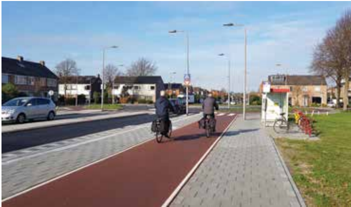
Driehuis met het nieuwe bushokje en zicht op de rotonde.

Tussen al deze discussies door is de fietsinfrastructuur op de Hagelingerweg vanaf de rotonde bij de Dreef tot de Zeeweg in IJmuiden in de loop van de jaren op 'doorfietsrouteniveau' gekomen. Het laatste stuk, tussen de spoorbaan en de rotonde bij "Het IJspaleis", is deze zomer gerealiseerd. Met de reconstructie van de Van den Vondellaan en de aansluitende rotonde is ook het laatste deel van de route CROW-proof gemaakt.