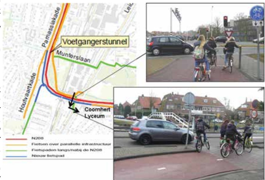
Gevaarlijke situaties: oversteek fietsers (foto dateert uit 2012)