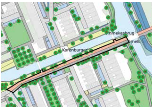
Foto boven: Bramelpad tussen Molenwijk en Meerwijk (het zwart omrande gedeelte van de rode weg) Foto rechtsonder: Het Bramelpad is klaar.