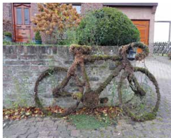
Ook in Mechelen (Zuid-Limburg) heeft de herfst zijn intrede gedaan