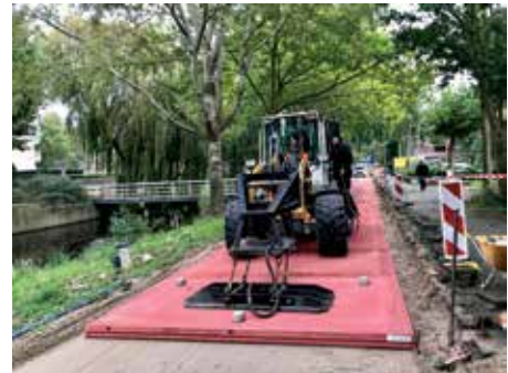
Foto rechts: Het Easypath wordt aangelegd op het Bramelpad. Dit type wegdek voorkomt wortelopdruk