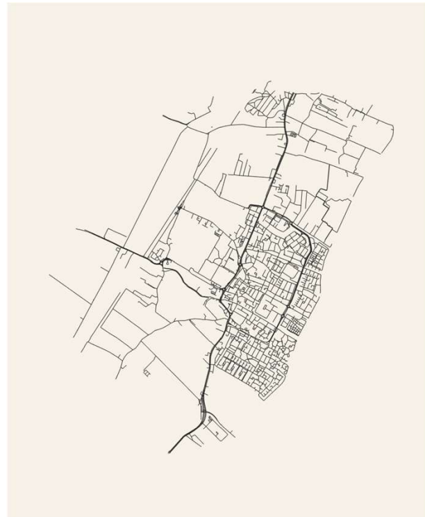
Edwin Voorbij- Holland Rijnland