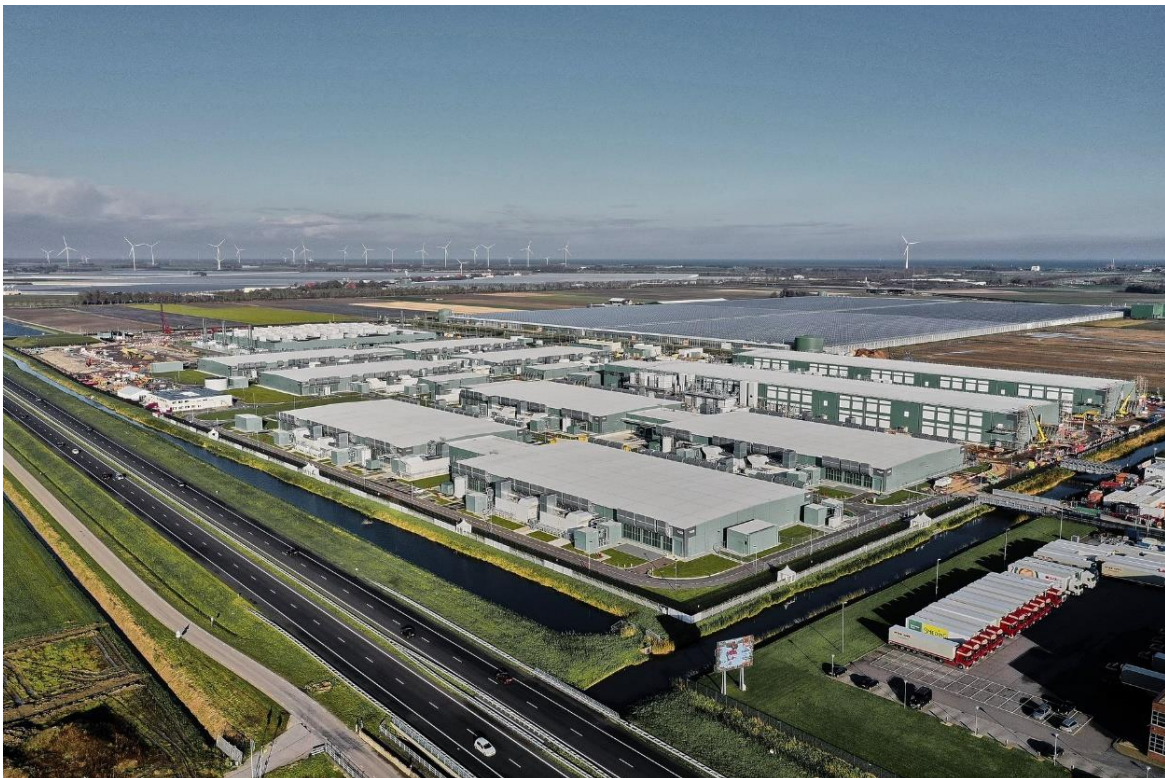
Overzicht situatie Datacenter Middenmeer 70 ha