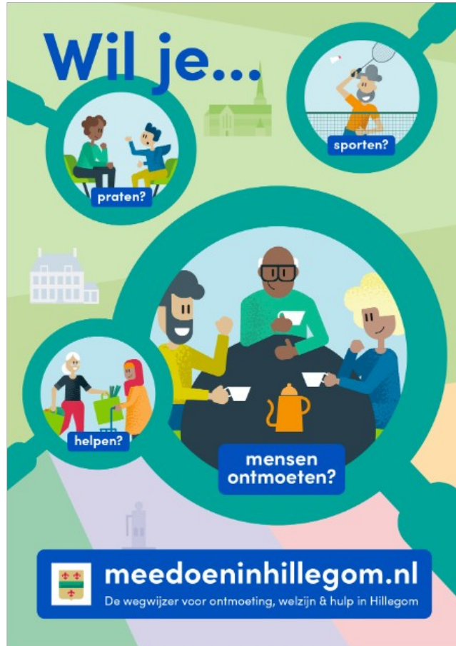
A0- en A3-poster en voorkant flyer