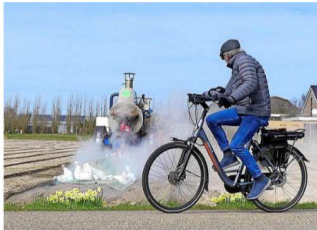
Op het gebied van beschermingsmiddelen te vermindern, wordt in de steek met nieuwe methoden getoetst, zoals met drone.