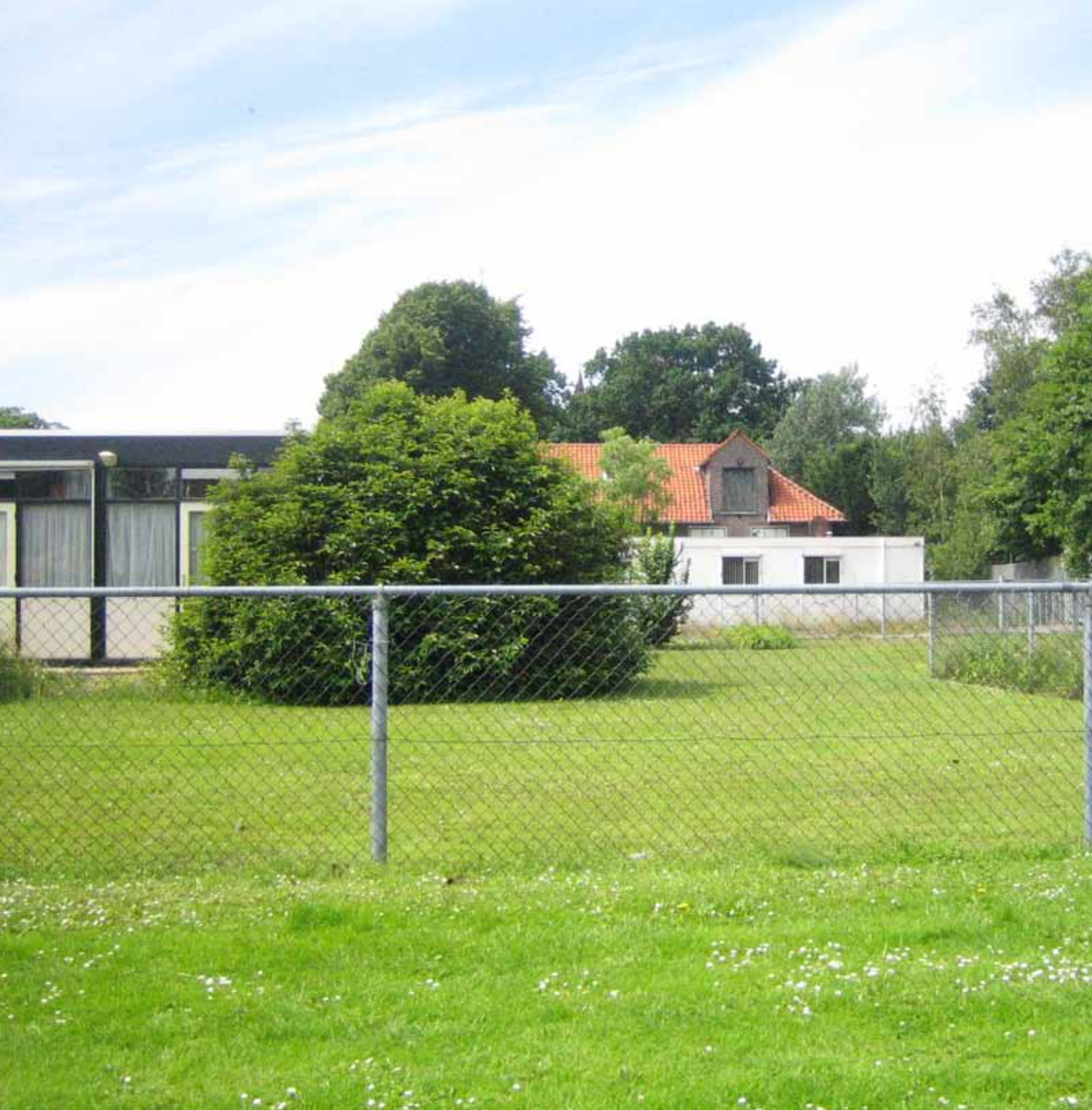
◀ St. Jozefpark vanaf het oosten