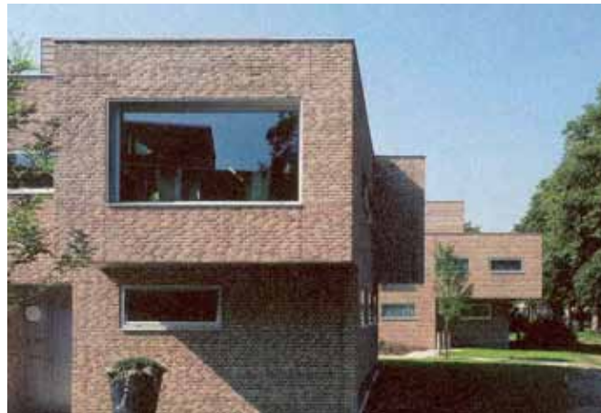
samenhang in materiaal, kleur en archtictuur