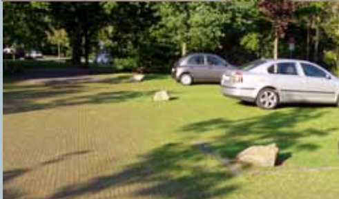
groene inpassing van parkeerplaatsen