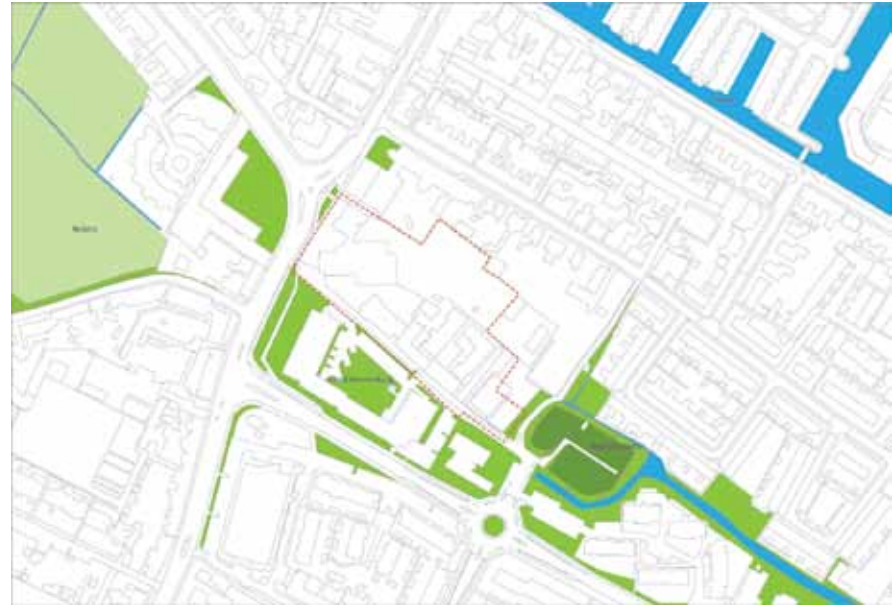
Groen en water