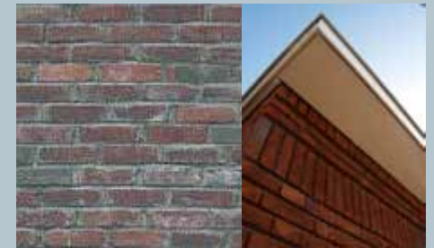
baksteen als hoofdmateriaal (tint rood/roodbruin/ antraciet)