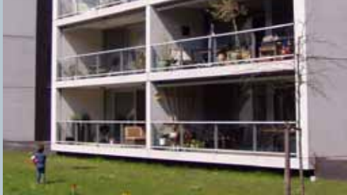
de buitenruimtes van de woningen zijn onderdeel van de parkruimte