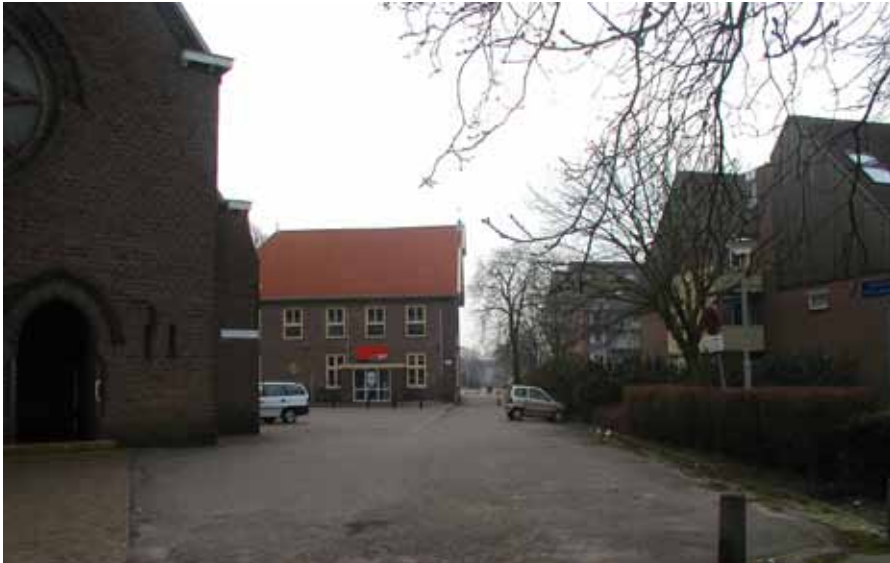
Monseigneur van Leeuwenlaan