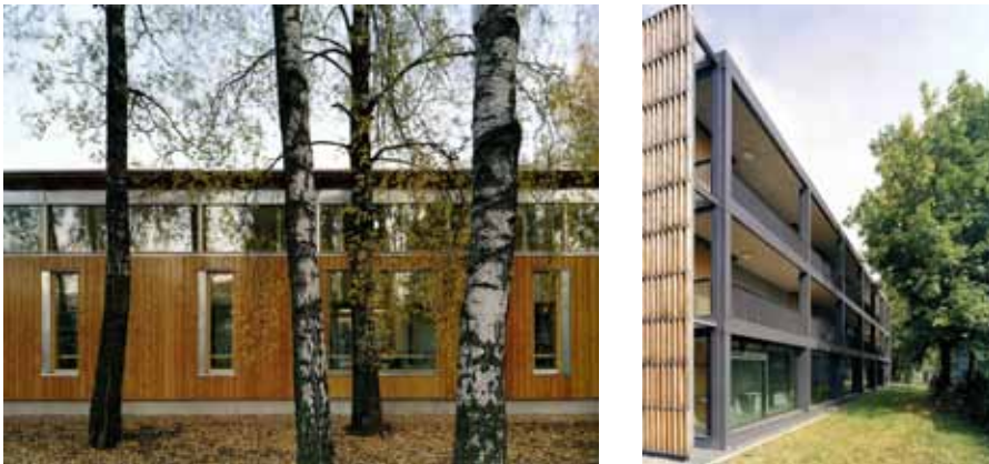
voorbeelden van eigentijdse architectuur en transparantie in de gevels