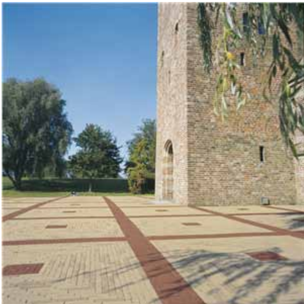
voorbeeld van bestrating rondom kerk