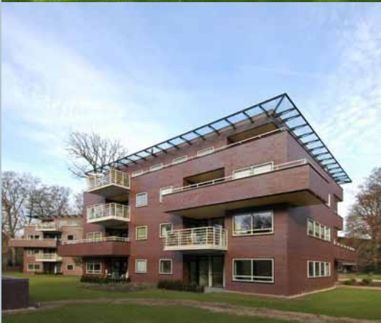
voorbeelden van bakstenen gebouwen in een groene omgeving