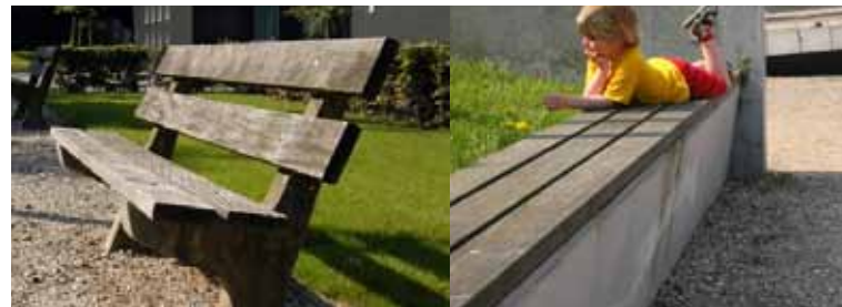
verblijfsplek in de parkachtige binnenruimte