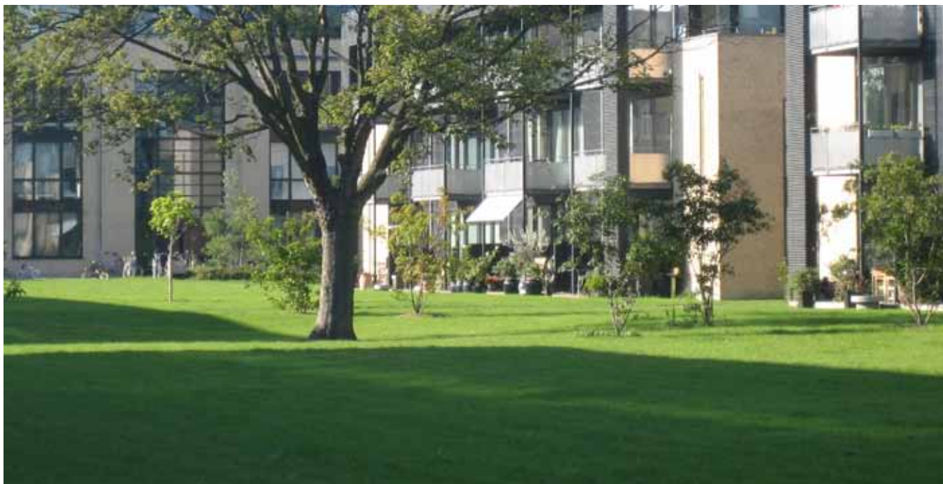
voorbeeld van een parkachtige binnenruimte