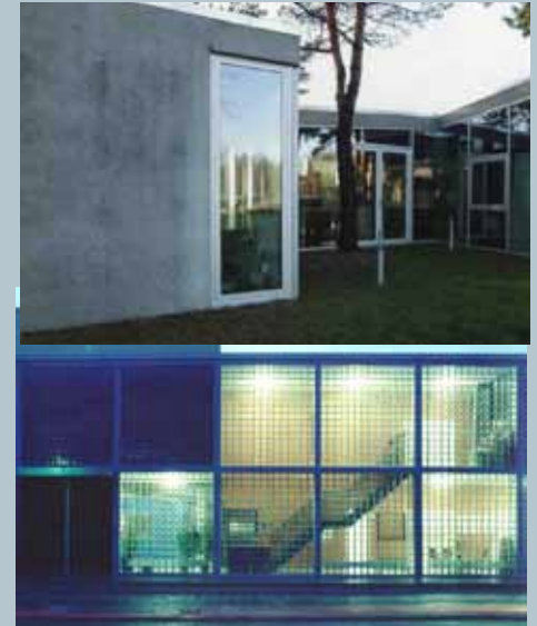
voorbeelden van transparante gevels