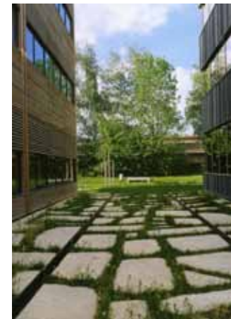
doorzicht naar een parkachtige ruimte